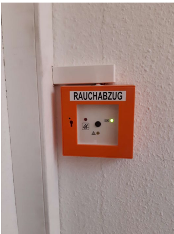
Druckknopftaster für Brandrauchentlüftung